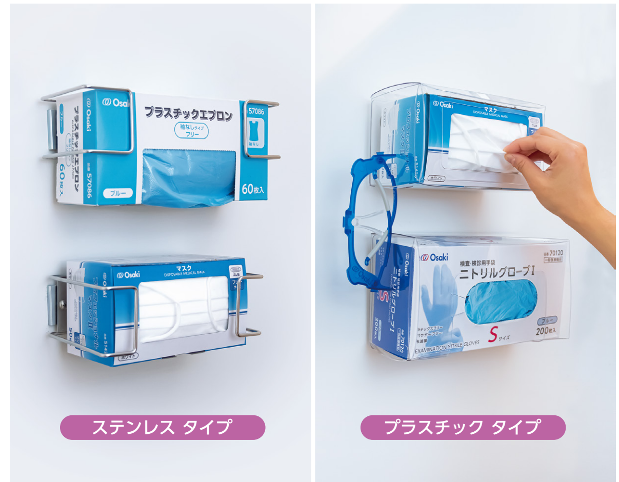
ステンレス タイプ